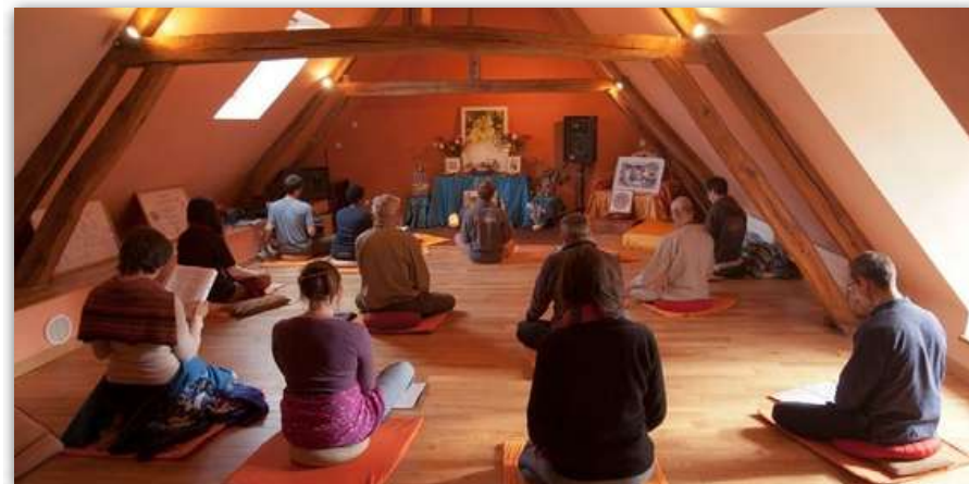
pratique spirituelle commune dans le temple

La vie apporte parfois des moments difficiles. Certaines émotions ou tensions peuvent aussi se réveiller au Centre. Si nous tentons par tous les moyens de les fuir, elles ne nous enseigneront rien. Voyons comment rester ouvert et accueillant sans couper court à un processus libérateur. Notre transformation est intimement liée à la manière dont nous traversons ces moments difficiles. Le bénéfice que nous retirerons de nos séjours dépend avant tout de nous et de l'intensité de notre détermination à nous éveiller. « Éveillez-vous mes enfants... » nous dit Amma.