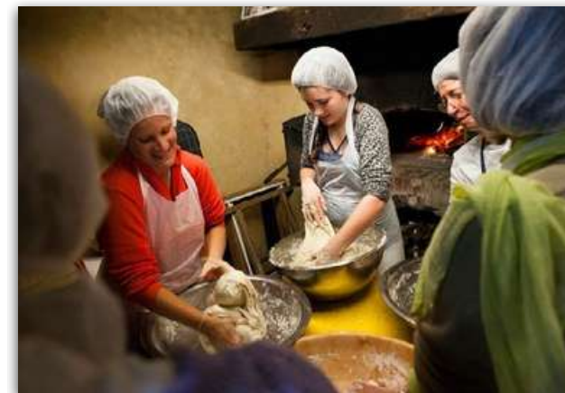
Fabrication du pain dans le fournil du Centre