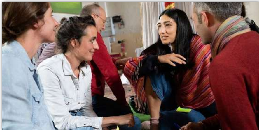
Moment de partage

Pour nous aider dans ce cheminement nous avons établi une charte comportementale du Centre. Elle se trouve dans le kit de gouvernance à votre disposition à l'accueil.