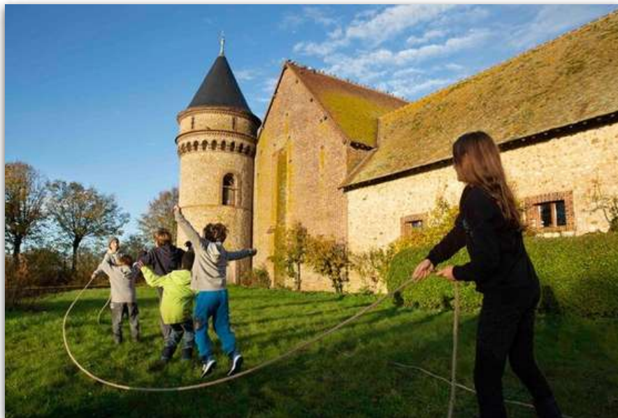
Acitivités avec les enfants

La salle Saraswati est la pièce la plus adaptée pour accueillir les enfants. On y trouve des livres et des BD, des coloriages, des vidéos et des jeux. Il est demandé aux parents de faire respecter les espaces et temps réservés au silence (temple, silence absolu pendant la méditation, repas) et au calme (chambres, réunions...).