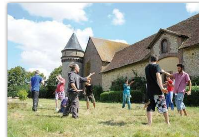
Cours de tai-Chi lors d'une rencontre de jeunes