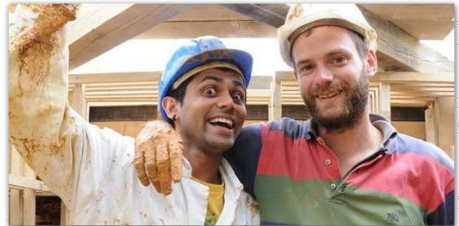
port d'un casque obligatoire sur un chantier