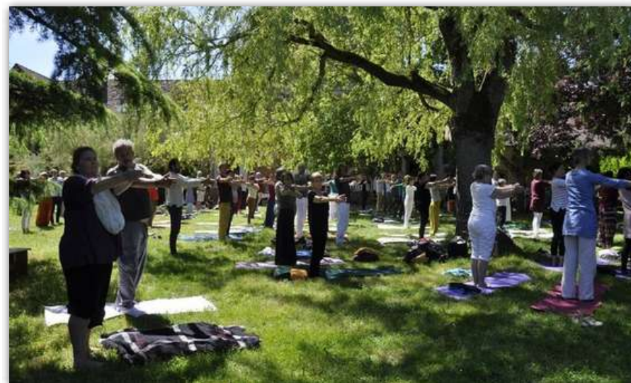
séance de yoga dans le parc du Centre

Les couples sont invités à respecter le caractère sacré du lieu dans l'ensemble de l'enceinte de la Ferme du Plessis.