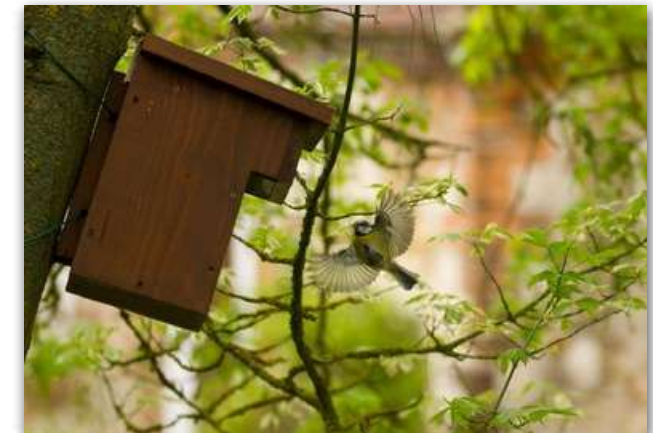
Une mésange bleue regagne son nichoir dans le parc