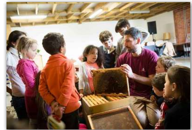
Activités apiculture avec les enfants