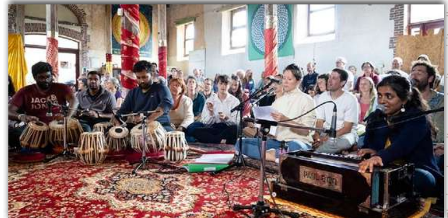
Bhajans lors d'une retraite spirituelle