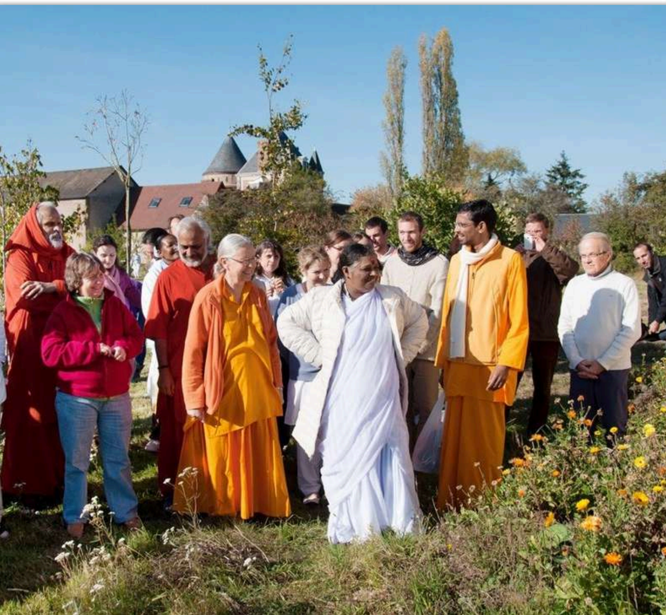
Visite d'Amma au Centre Amma en 2011