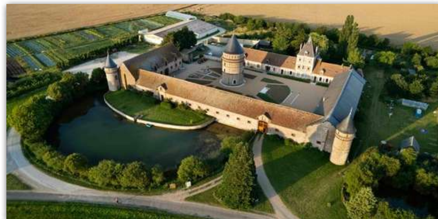
Le Centre Amma vu d'un paramoteur

Le dévouement d'Amma au service d'autrui est à l'origine d'un vaste réseau d'activités humanitaires regroupées dans une ONG internationale, Embracing the World (ETW) qui a le statut de consultant au Conseil économique et social des Nations Unies.