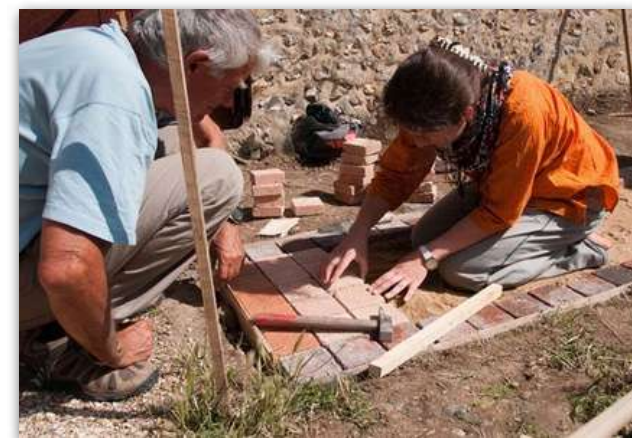
réalisation d'une allée en pavé pour le jardin de curé