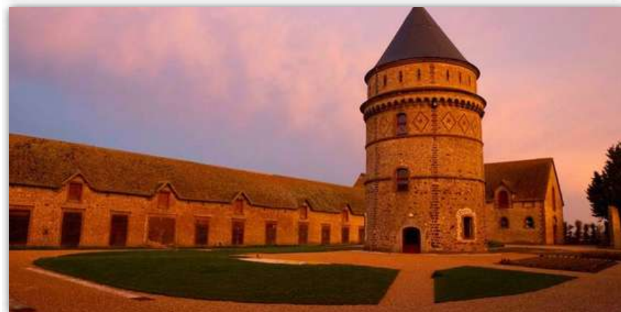
La bibliothèque est située à l'étage du donjon.