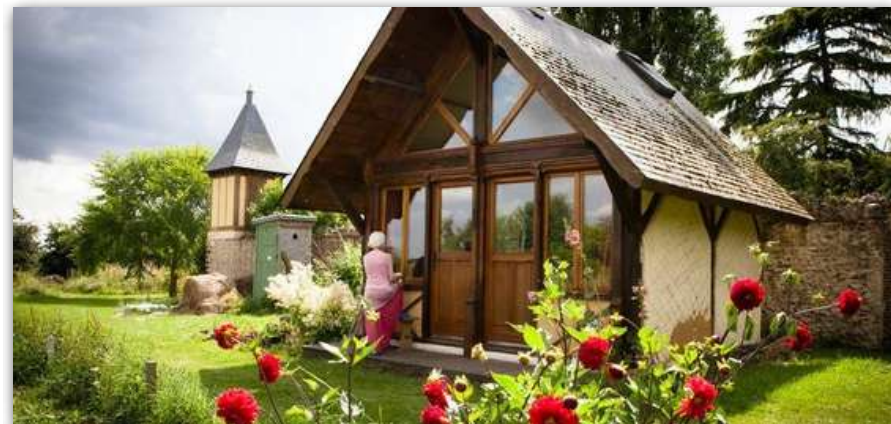
Le bungalow écologique