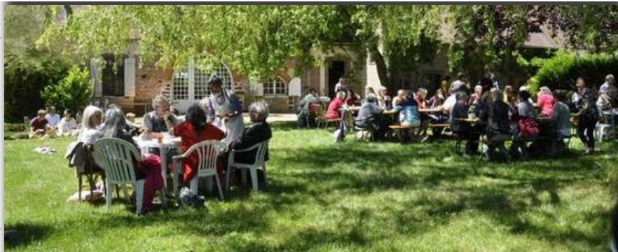
Repas en silence dans le parc

Le petit déjeuner et le déjeuner sont pris en silence (voir paragraphe silence ci-dessous). Ceux qui souhaiteraient échanger pendant ces repas (famille, amis de passage...) peuvent aller dans le foyer ou bien dehors en prenant soin de ne pas déranger ceux qui souhaitent garder le silence. Le dîner au contraire est l'occasion d'échanges, en particulier avec l'envoyée d'Amma : n'hésitez pas à vous asseoir près d'elle à ce moment là.